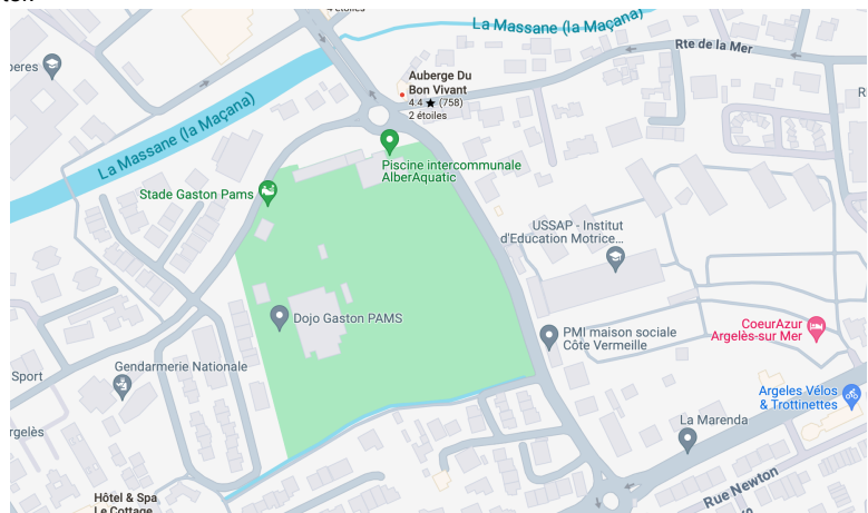
Plan des installations à Argelès-sur-Mer